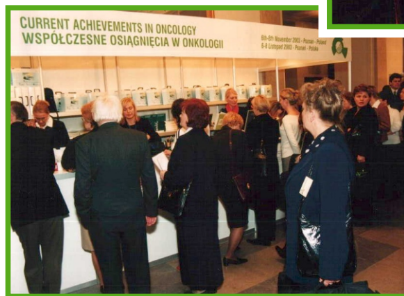
Biuro Konferencyjne w Centrum Kultury "Zamek" w Poznaniu.