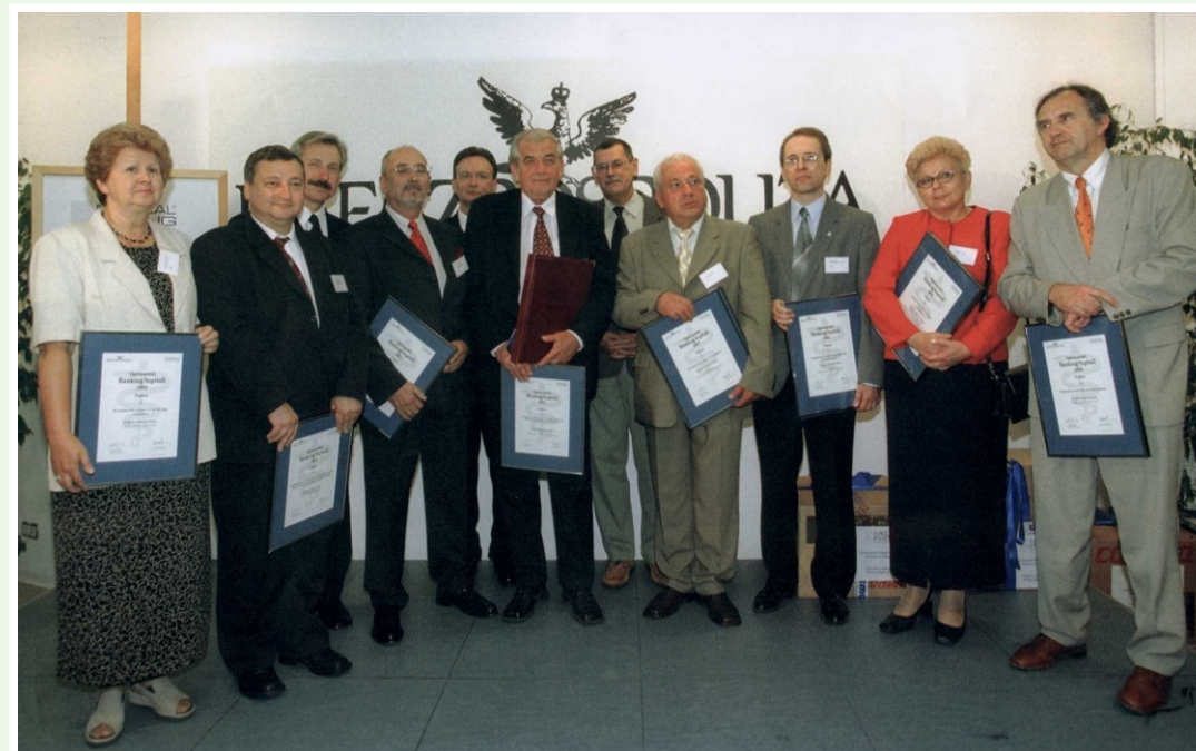
Ogólnopolski Ranking Szpitali wg dziennika "Rzeczpospolita".

Na zlecenie redakcji „Rzeczpospolitej” firma Medical Rating S.A. przeprowadziła badania poziomu usług szpitali sektora publicznego i niepublicznego. Szczegółowa lista 100 najlepszych szpitali w Polsce została opublikowana w „Rzeczpospolitej” 24 czerwca 2002 r. Wielkopolskie Centrum Onkologii zajęło na niej wysokie 9 miejsce. W kolejnych ogólnopolskich rankingach przeprowadzonych przez tygodnik „Newsweek” Wielkopolskie Centrum Onkologii zajęło 2 i 3 miejsce, a w rankingu tygodnika „Wprost” 1 miejsce wśród szpitali onkologicznych. W rankingu „Pulsu Biznesu” w kategorii wszystkich przedsiębiorstw Wielkopolskie Centrum Onkologii zajęło wysokie 456 miejsce w kraju, uzyskując tytuł „gazeli biznesu”.