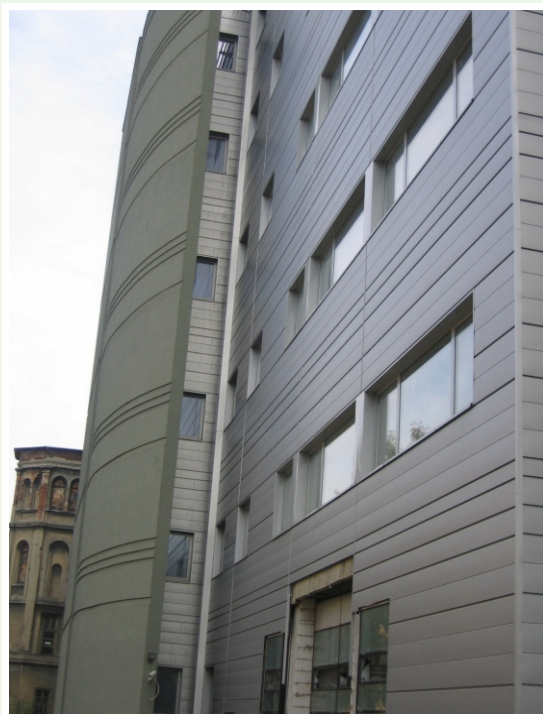
Wielkopolskie Centrum Onkologii od strony ul. Strzeleckiej. Z przodu: nowe skrzydło szpitala, które zostanie ukończone w 2005 r., z tyłu: Kantor dawnej fabryki Cegielskiego (w restauracji) - administracja Centrum.

skrzydle szpitala znajdzie miejsce medycyna nuklearna, brachyterapia, nowoczesny blok operacyjny, pomieszczenia laboratoryjne i diagnostyczne. Poprawią się też warunki oczekiwania chorych na poradę lekarską i badania diagnostyczne.