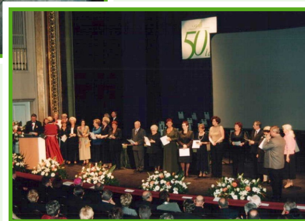
Uroczystość 50-lecia Wielkopolskiego Centrum Onkologii w Teatrze Wielkim w Poznaniu.