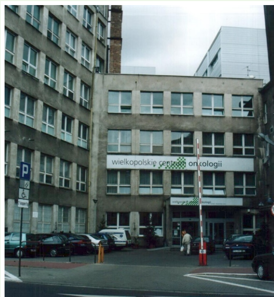
Wielkopolskie Centrum Onkologii. Główne wejście od strony ul. Garbary 15.

chirurgicznego i radiologicznego systemową chemioterapią stworzyło podstawę do tzw. „leczenia skojarzonego”, czyli stosowania kombinacji różnych metod leczenia. Wykorzystanie nowych dziedzin nauki zwłaszcza immunologii, farmakologii, fizyki, elektroniki i genetyki poprawiło dotychczasowe wyniki leczenia chorób nowotworowych.