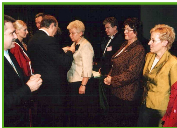
Wręczenie Krzyży Zasługi przez Wojewodę Wielkopolskiego Andrzeja Nowakowskiego.