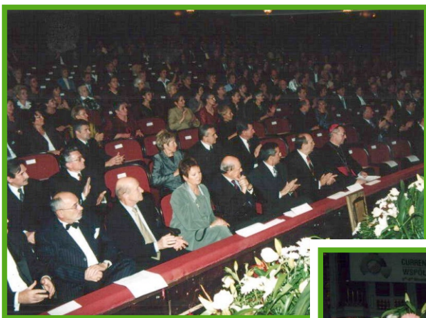
Uroczystość 50-lecia Wielkopolskiego Centrum Onkologii w Teatrze Wielkim w Poznaniu.