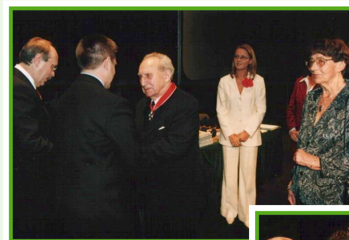
Wręczenie zasłużonym pracownikom Orderów Odrodzenia Polski przez Ministra Zdrowia Leszka Sikorskiego i Wojewodę Wielkopolskiego Andrzeja Nowakowskiego.