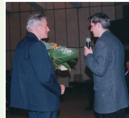
Obchody 45-lecia Wielkopolskiego Centrum Onkologii w Poznaniu.

Podstawowym zadaniem Wielkopolskiego Centrum Onkologii jest działalność lecznicza, diagnostyczna i propagowanie zasad wczesnego wykrywania nowotworów (co roku przeprowadzane są liczne badania przesiewowe dla wybranych grup ludności regionu Wielkopolski finansowane przez Ministerstwo Zdrowia i regionalne kasy chorych). Dzisiaj Wielkopolskie Centrum Onkologii jest jednym z największych ośrodków onkologicznych w kraju. Centrum zostało zaliczone do jednego z pięciu ośrodków referencyjnych w zakresie radioterapii w kraju. W roku 1999 rozpoczęto dalszą rozbudowę szpitala ze środków budżetu państwa. Rozbudowa potrwa do roku 2004 i ma na celu zapewnienie chorym wszechstronnego dostępu do prowadzonej diagnostyki oraz szeroko pojmowanej terapii przeciwnowotworowej. W nowo budowanym