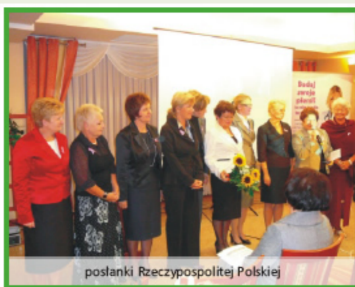
posłanki Rzeczypospolitej Polskiej