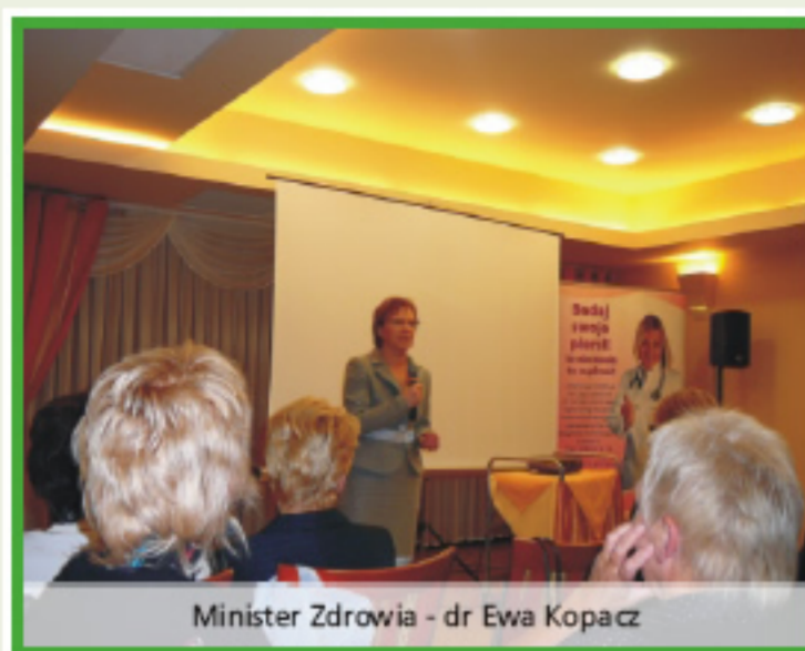
Minister Zdrowia - dr Ewa Kopacz