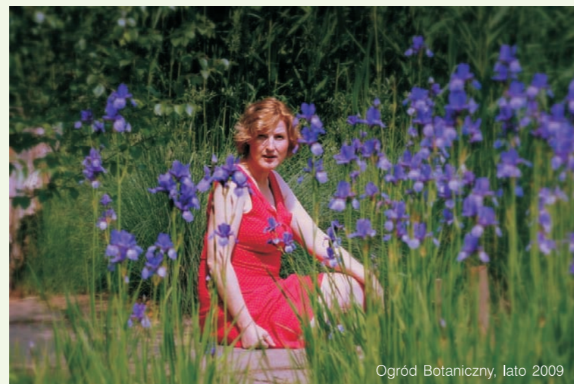
Ogród Botaniczny, lato 2009

„Ktoś porównał kiedyś ludzi, których spotykamy w życiu do pięknych ptaków. Nie potrafimy ich zatrzymać kiedy przysiadają w naszych oknach. Możemy je jedynie podziwiać i być wdzięczni, że były z nami chociaż chwilę.”