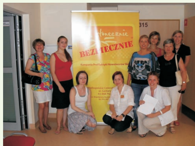
Uczestnicy kampanii w oczekiwaniu na badanie skóry