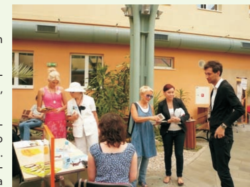
Ogród zimowy konsultacje firm kosmetycznych